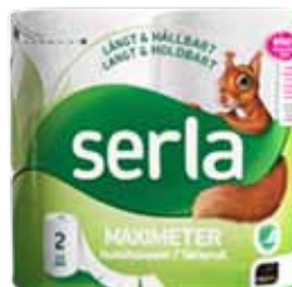
Serla hushållspapper 210 kr 2 pack (levereras i säck 2x6 = 12 rullar)

Beställ gärna via något av våra lag då lagen tjänar en extra slant till sin lagkassa på detta. Har ni inga känningar i fotbollslagen så går det självklart bra att beställa hos Anita på kansliet, kansliet@rydboholmssk.se , 033-29 11 70.