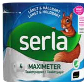
Serla toalettpapper 220 kr 4 pack (levereras i säck 4x6 = 24 rullar)

När ni köper papper av oss så köper ni produkter som alla använder varje dag, samtidigt så hjälper ni oss som en ideell förening eftersom överskottet går till våra idrottande barn och ungdomar. Ni får kvalitetsprodukter från Serla levererade direkt till er dörr.