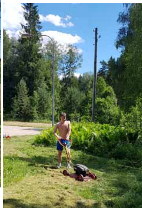
Ungdomarnas arbete vid Storsjögården