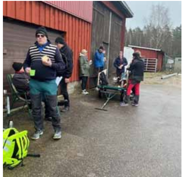
En välförtjänt fikapaus för några av de hårt arbetande.