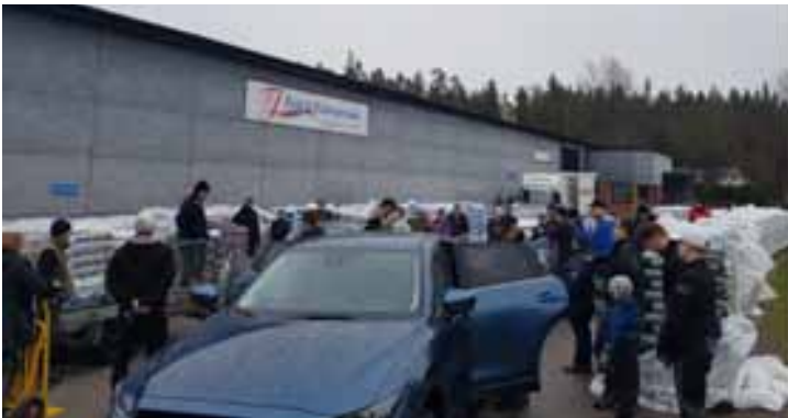
Alla står samlade och lyssnar på ordförandens årliga tal.