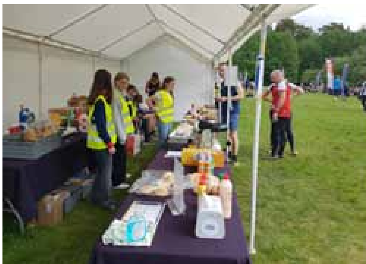
Som vanligt fanns serveringen på plats och erbjöd ett stort utbud av godsaker.