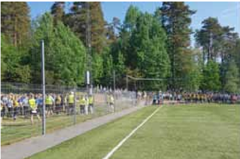
Sekunder innan masstarten startar!