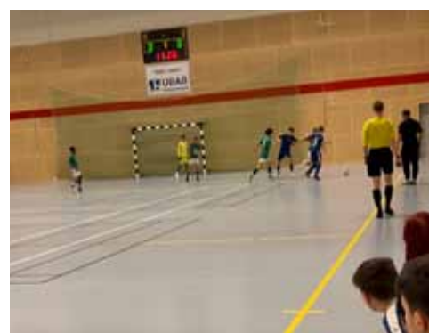
Inomhus Cup i Rångedala

3. Taktisk förberedelse: Det vi pratar om i teorin försöker vi omsätta i spel för att förstärka lagets taktik, formationer, fasta spel och strategier för att säkerställa att spelarna förstår sina roller och ansvar på planen. Sedan snön försvann i januari har vi kört utomhus träning på SE vallen 2 dagar i veckan. Dock anpassar vi efter väder och i skrivande stund kom snön tillbaka och då kör vi löpträning utomhus.