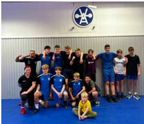
Gänget inomhus FYS VAK