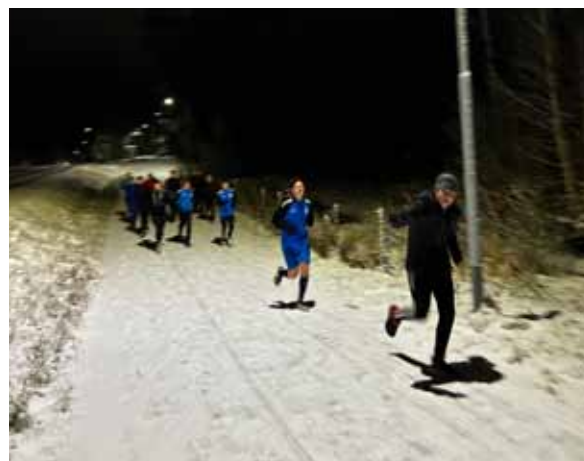
Löpning när snön ligger på SE-vallen