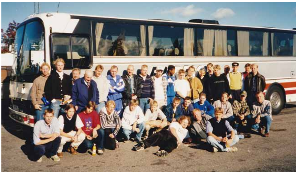
Avresa från SE-Vallen