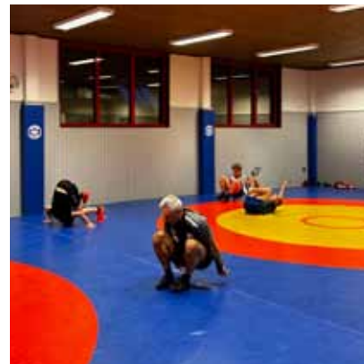
Även tränare gör kullebyttor

2. Färdighetsutveckling: Fram till jul körde vi ett upplägg med futsal, som avslutades med futsal turnering i Rångedala. Våra spelare har genom futsal förbättrat sina tekniska färdigheter som passningar, skott, dribblingar och bollkontroll, fatta snabba beslut, detta ser vi nu tydliga resultat av när utesäsongen börjat.