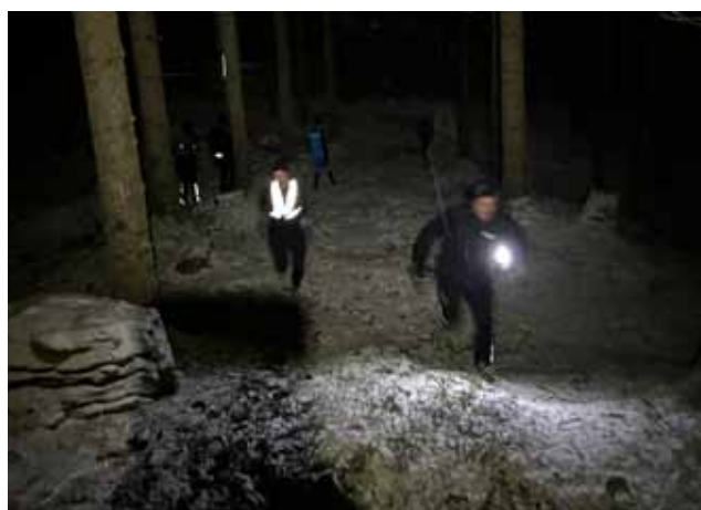
Backintervaller i terräng