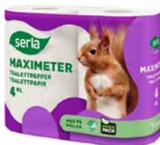
Serla toalettpapper 265 kr 4 pack (levereras i säck 4x6 = 24 rullar)

Överskottet går till våra idrottande barn och ungdomar.