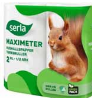
Serla hushållspapper 255 kr pack (levereras i säck 2x6 = 12 rullar)

Beställ gärna via något av våra lag då lagen tjänar en extra slant till sin lagkassa på detta.