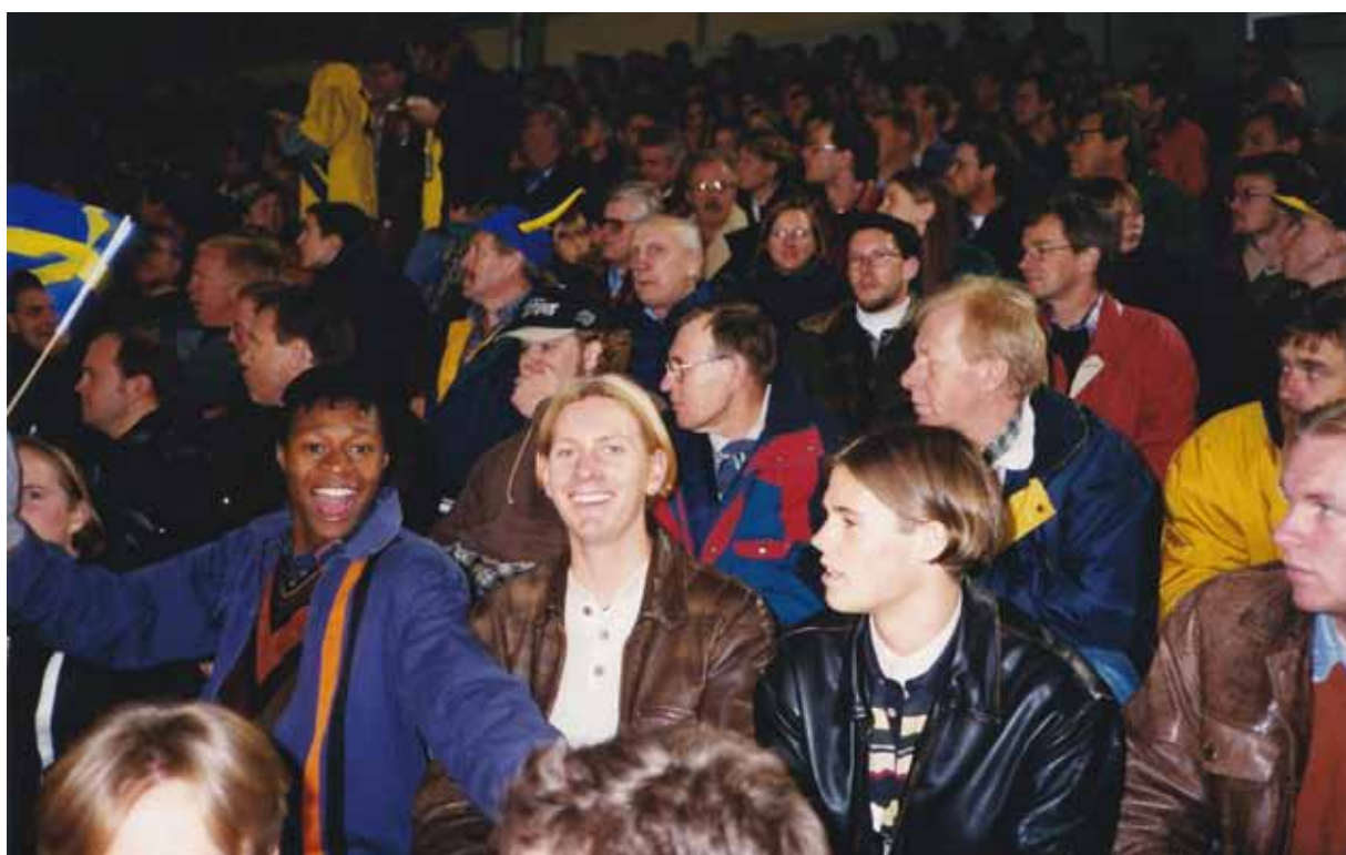
Några RSK:are bland publiken